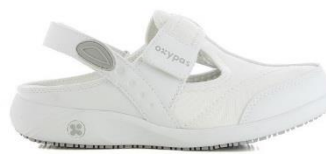
023101 WHT Белый

ANAIS – специально разработана ортопедами для анатомической поддержки ступни с опухлостями и деформациями (вальгусная, варусная, молотковая косточка...). Обувь подходит для ступней любой полноты благодаря регулируемым ремешкам в верхней и задней части обуви и стрейчевому материалу. Вертикальная вставка защищает пальцы при ударах спереди.