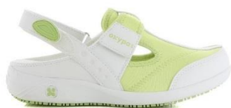
023601 LGN Светло-Зеленый