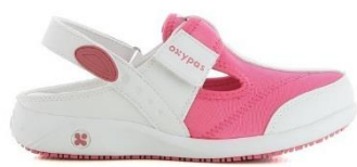
023401 FUX Фуксия