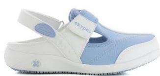
023201 LBL Светло-Голубой